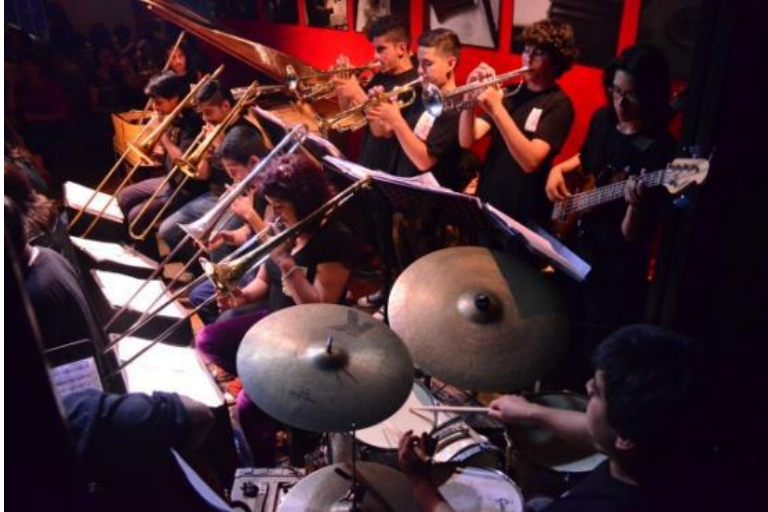
Concierto Teatro Municipal