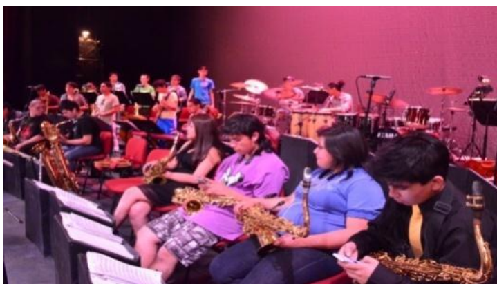
Concierto Lo Prado